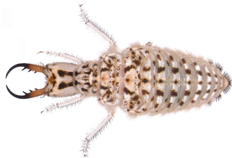
Larva da Badano & Pantaleoni, 2014

Le larve di questo formicaleone, abbondanti solo nei tratti di costa meno degradati, colonizzano le sabbie sciolte alla sommità delle dune litoranee (a volte spingendosi fino addirittura la battigia), di solito in corrispondenza dell'associazione vegetale Ammophiletum (Principi, 1947b; Steffan, 1975, Pantaleoni, 1990). Le località di cattura sono generalmente prossime al litorale. Le larve, spesso sepolte alla base delle piante psammofile, dove sono protette dagli agenti atmosferici, sono predatori aggressivi e attivi, in grado di portare avanti rapidamente la preda per un breve tratto; durante il giorno sono nascoste sotto la superficie della sabbia, cacciando alla posta, mentre durante la notte vagano liberamente sulle dune (Badano & Pantaleoni, 2014).