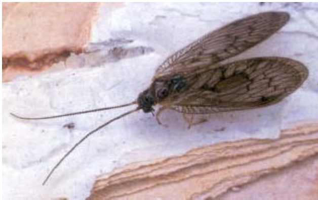
Adulto da Gepp J., 1999

Specie piuttosto euriecia, anche se, nella parte meridionale del proprio areale, si trova solo in quota (Aspöck et al., 1980). Studi condotti in Italia la segnalano sia su Faggio che Abete rosso (Pantaleoni, 1988).