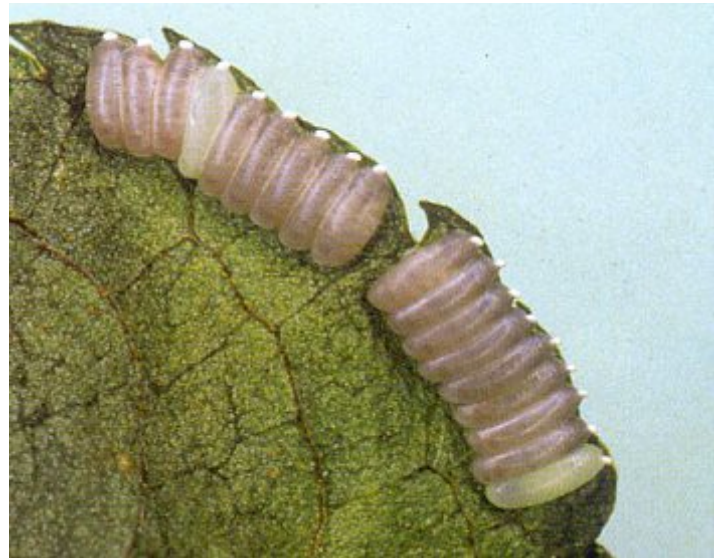
Uova da Gepp J., 1999

Gli adulti di questa specie si rinvergono normalmente sulla vegetazione prossima ai torrenti di zone boschive, habitat preferenziale delle larve semi-acquatiche (Elliot, 1977; Aspöck et alii, 1980). Larve predatrici che vivono tra muschi e massi in acque poco profonde, in ambienti ritrali di basso ordine sino ad una quota di 1500 m. s.l.m. (Bo & Fenoglio, 2005). In Romagna è stata catturata in numerose località rispondenti a queste caratteristiche. Monovoltina, presenta un massimo di abbondanza in giugno quando è ancora in vita la porzione maschile della popolazione. Le femmine, piuttosto longeve, si rinvergono poi fino all'inizio d'agosto (Pantaloni, 1989a).