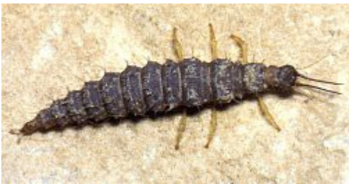
da Aspöck U. & H., 1999