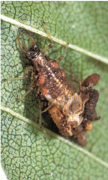
larva da Wachmann & Saure, 1997