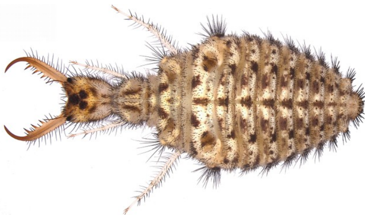
Larva da Badano & Pantaleoni, 2014

Specie legata alle sabbie più o meno fini delle spiagge marine ma anche delle dune interne e dei depositi fluviali lungo i principali corsi d'acqua (Principi, 1943a; Steffan, 1975; Aspöck et al. , 1980). In Romagna appare comune lungo il litorale. Le sue larve, "scavatrici d' imbuti", si rinvengono in gran numero ovunque vi siano piccoli spazi di terreno sgombro "a sabbie sciolte" sufficientemente protetti dal vento (Principi, 1943a; Pantaleoni, 1982). M. inconspicuus è spesso il pit-costruzione formicaleone costruttore di imbuti più comune su dune costiere, colonizzando sia le dune aperte che ambienti retrodunali con una vegetazione complessa; ciò nonostante nelle coste meridionali del Mediterraneo viene sostituito in condizioni esposte da più specie termofile (Badano & Pantaleoni, 2014).