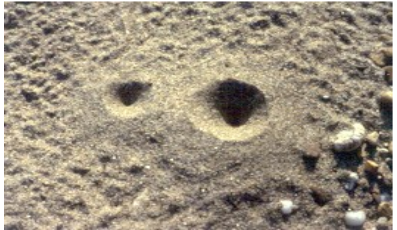
Imbuti larvali