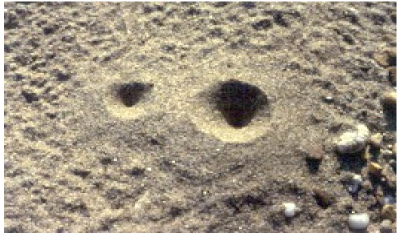
Imbuti larvali