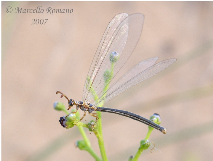
Maschio foto Romano