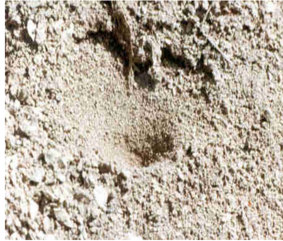
Imbuto larvale

Specie relativamente euriecia, con larve costruttrici d'imbuti, che rifugge comunque i climi troppo caldi e secchi (Steffan, 1975; Aspöck et al., 1980). In Romagna si trova confinato nella fascia collinare, con sporadiche e del tutto occasionali catture per la pianura e per il crinale (Pantaleoni, 1990). Lungo le scarpate, in microhabitat protetti dalla pioggia per la presenza di una roccia sporgente o delle radici di un albero, dove vi è un po' di terreno smosso, abbondano gli imbuti costruiti dalle sue larve.