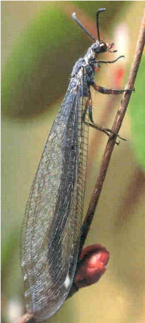
Adulto Foto Wachmann & Saure, 1997