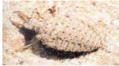
Larva Foto K. Hellrigl, 1992