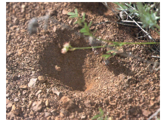
In senso orario dall'alto a sx: maschio da Wachmann & Saure, 1997; femmina in Franco, 2008d; imbruto larvale da Wachmann & Saure, 1997; larva da Wachmann & Saure, 1997