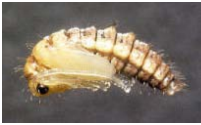
pupa da Aspöck U. & H., 1999

Specie legata, probabilmente in modo esclusivo, allo strato erbaceo; relativamente euriecia si rinviene sia in biotopi umidi che caldo-secchi (Aspöck et al., 1980), spostandosi anche sulle latifoglie. Sverna come adulto, riuscendo in condizioni ottimali a sviluppare alte densità di popolazione. Tra gli Emerobidi è probabilmente il più efficace predatore di afidi su graminacee ed