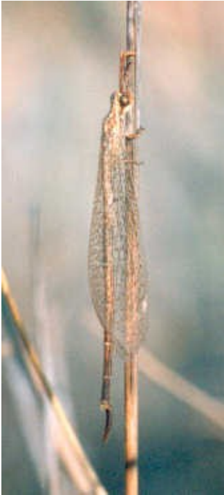
Adulto maschio