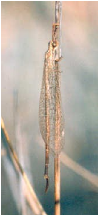
Adulto maschio Foto A. Letardi originale