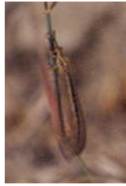
Adulto femmina Foto A. Letardi originale