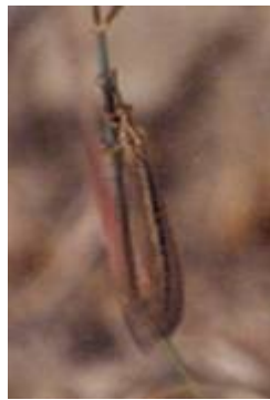
Adulto femmina originale