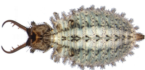
Larva da Badano & Pantaleoni, 2014b

Questo Ascalafide colonizza principalmente la più bassa fascia collinare e raramente risale sopra i 600 - 700 m di quota. Il periodo di volo