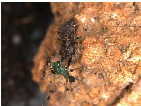
Maschio Larva