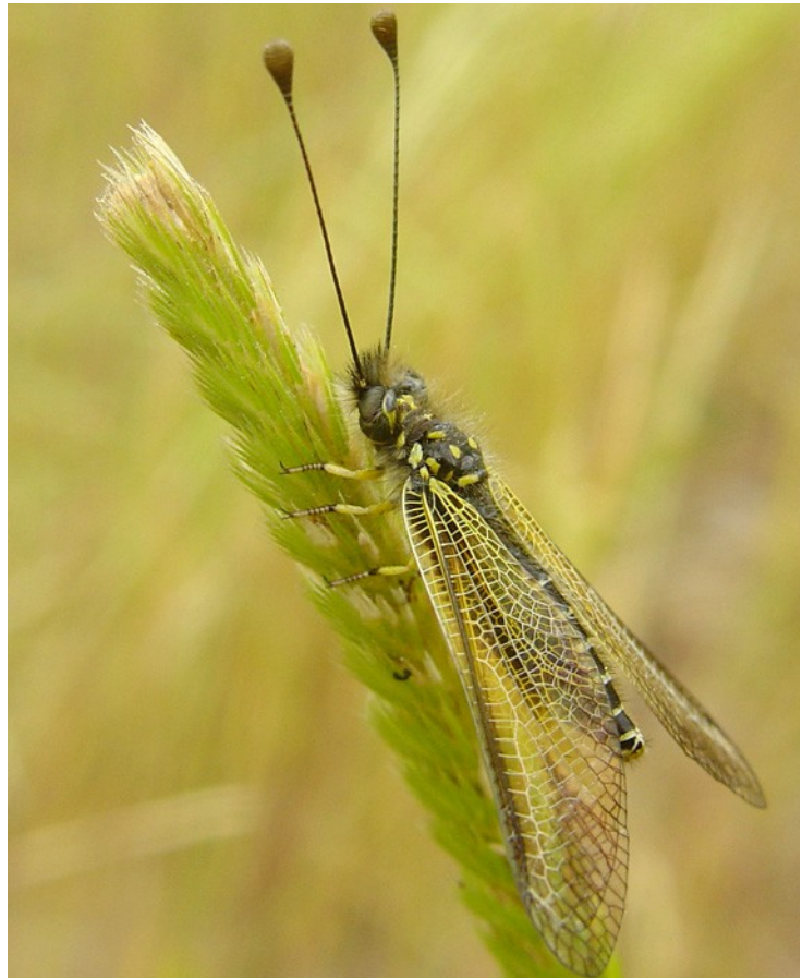
Femmina da Niolu, 2007