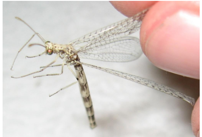
adulto(sopra), larva (sotto)