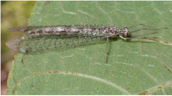
adulto(sopra), larva (sotto)