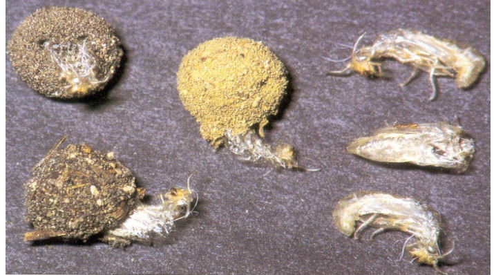
Bozzoli ed esuvie pupali da Gepp J., 1999