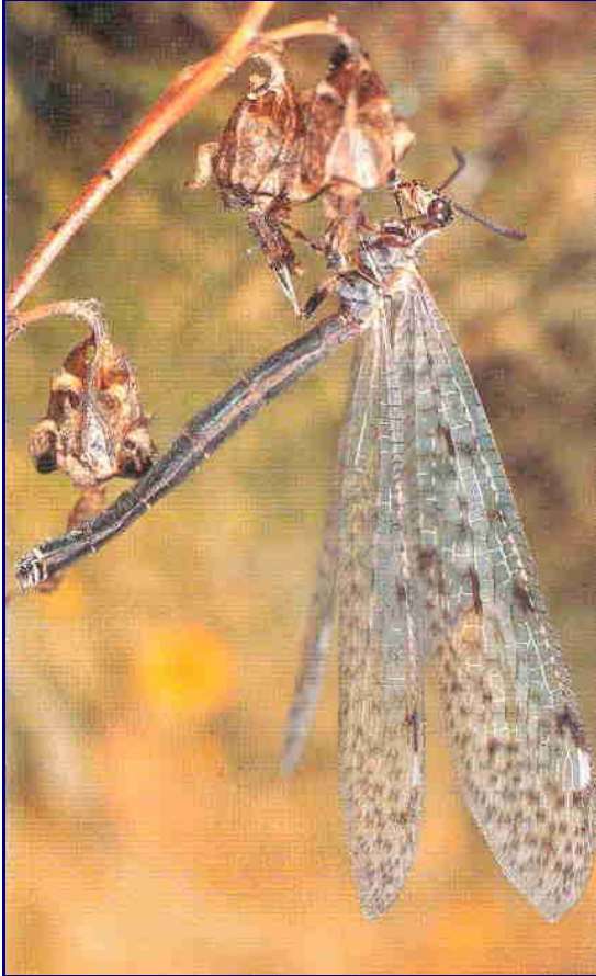
Adulto da Wachmann & Saure, 1997