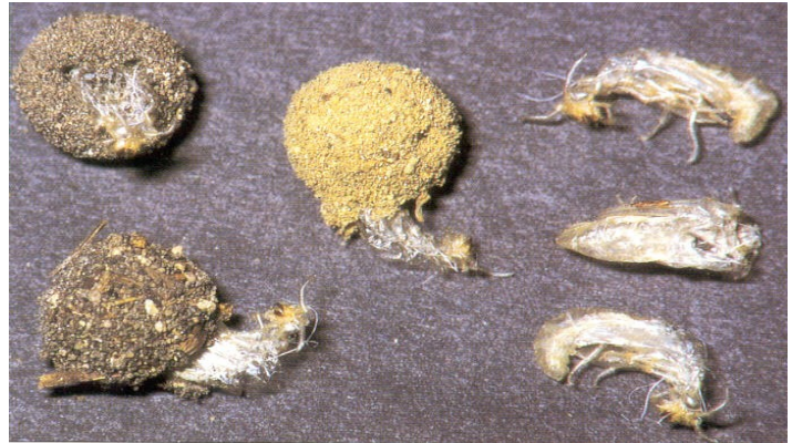
Bozzoli ed esuvie pupali da Gepp J., 1999