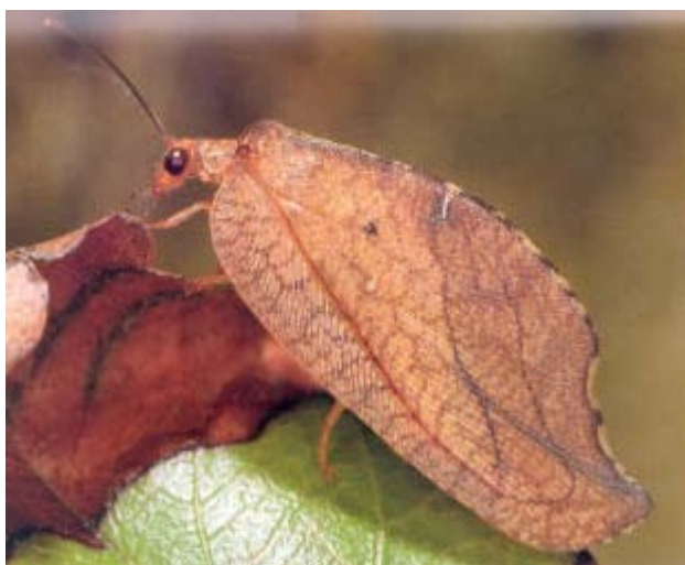
adulto da Wachmann e Saure, 1997