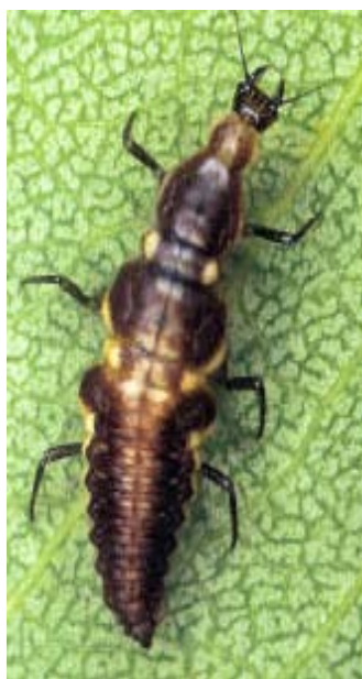
larva