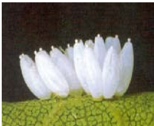
uova da Gepp J., 1999

Drepanopteryx phalaenoides è una specie ampiamente diffusa su varie latifoglie e arbusti; generalmente non raggiunge mai alte densità di popolazione.