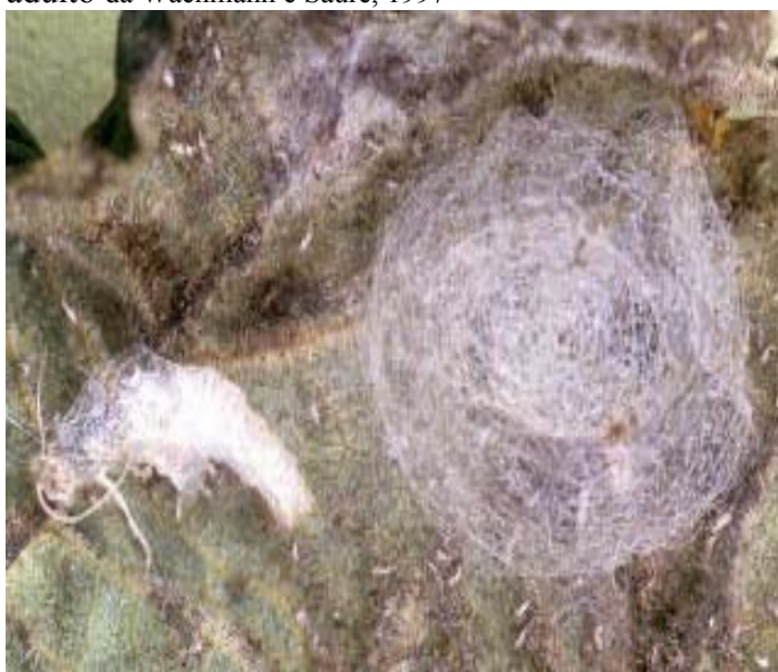
bozzolo ed esuvia pupale da Gepp J., 1999