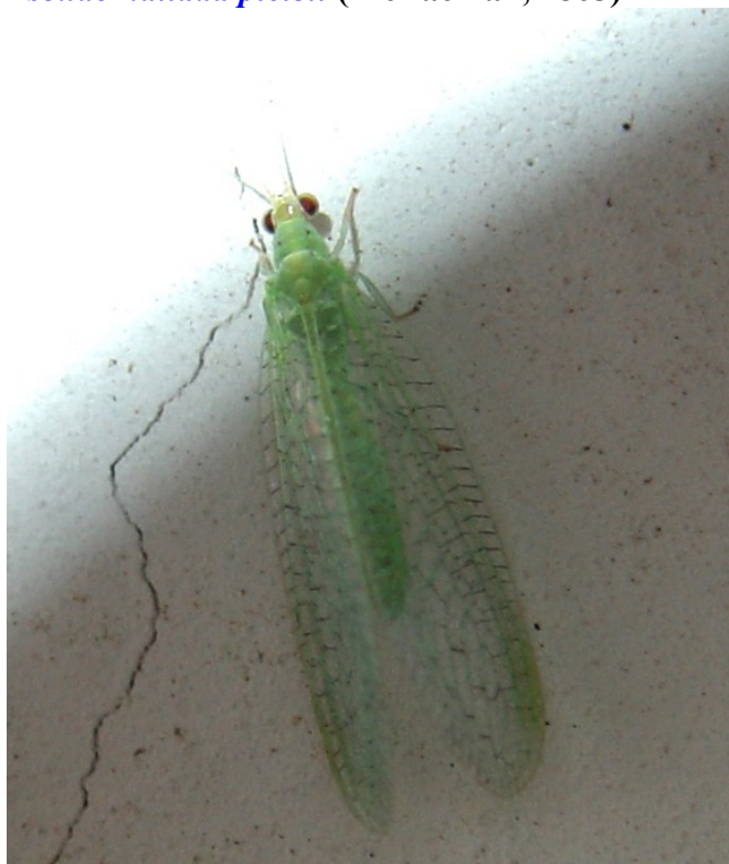
Adulto dal web