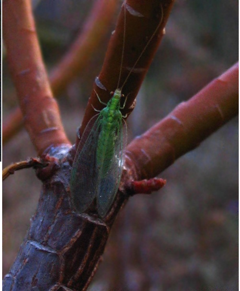
adulto da Casnati, 2007g

Senza particolari esigenze ecologiche o di habitat, frequenta gli strati arboreo ed arbustivo, per lo più delle latifoglie, pur senza disdegnare le Conifere (Principi, 1956a), con presenze diffuse seppur poco abbondanti in Europa centro-settentrionale, ove sembra mostrare una certa preferenza per le quercete tendenzialmente calde (Aspöck et al., 1980). Specie sub-dominante invece in habitat semi-naturali di aree mediterranee. Non è escluso che questa genericità ecologica derivi dalle difficoltà tassonomiche. E' stata rinvenuta in Romagna sia su latifoglie che su Conifere; è una delle specie più abbondanti su Pinus (Pantaleoni, 1988). Questa specie è un predatore chiave per il controllo di popolazioni afidiche, in particolare in vigneti ed oliveti.