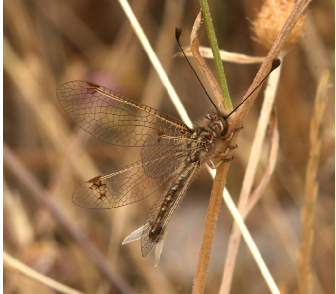
Femmina da Niolu, 2007