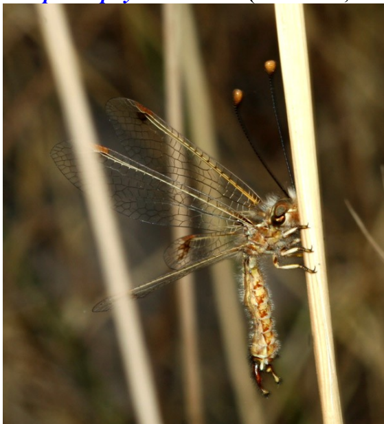
Maschio da Niolu, 2007