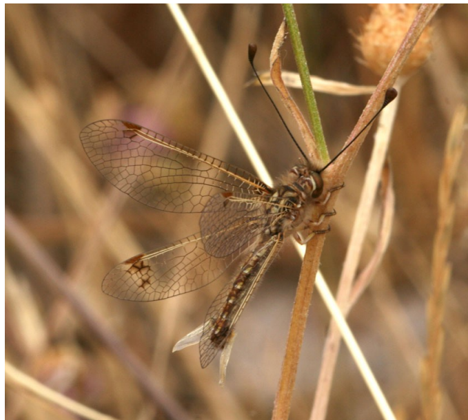
Femmina da Niolu, 2007