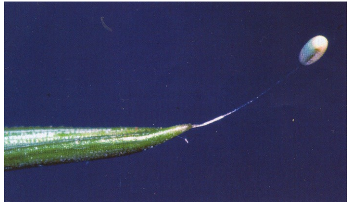
Uovo da Aspöck., 2007

Specie assai poco nota, di difficile discriminazione, legata alle conifere del genere Pinus (Aspöck et al., 1980; Duelli, 1987). L'unica cattura nota in Romagna è stata effettuata su Abete rosso (Pantaleoni, 1988). Presente dal livello del mare sino, in area sud-europea, ai 1200 m (Aspöck et al., 1980).