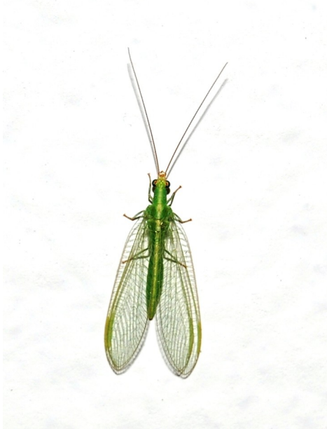
Adulto da Tato, 2008