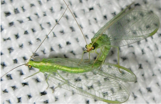
Coppia in Baviera, 2009