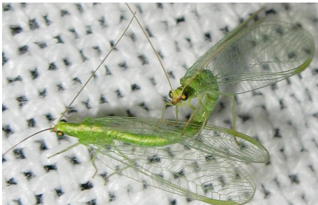
Coppia in Baviera, 2009