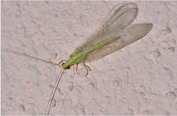
Adulto in Muscarella, 2009c