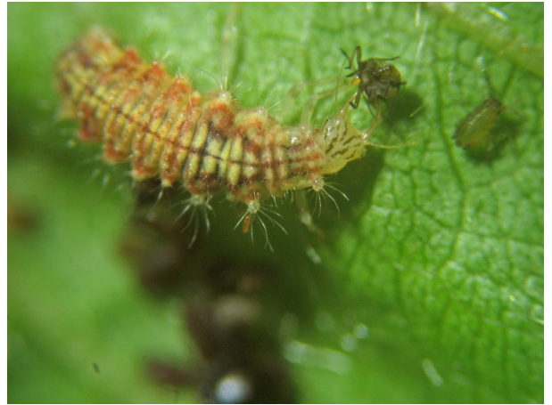
Larva da Castiglioni, 2010

Si tratta di una specie legata alle latifoglie degli strati arboreo ed arbustivo con una chiara preferenza per il genere Quercus (Principi, 1954; Aspöck et al., 1980). Anche durante le ricerche condotte in Romagna è stata raccolta quasi esclusivamente su Roverella. Da segnalare la cattura di alcuni individui su varie latifoglie. Si tratta senza dubbio di esemplari ivi immigrati dai sottostanti querceti.