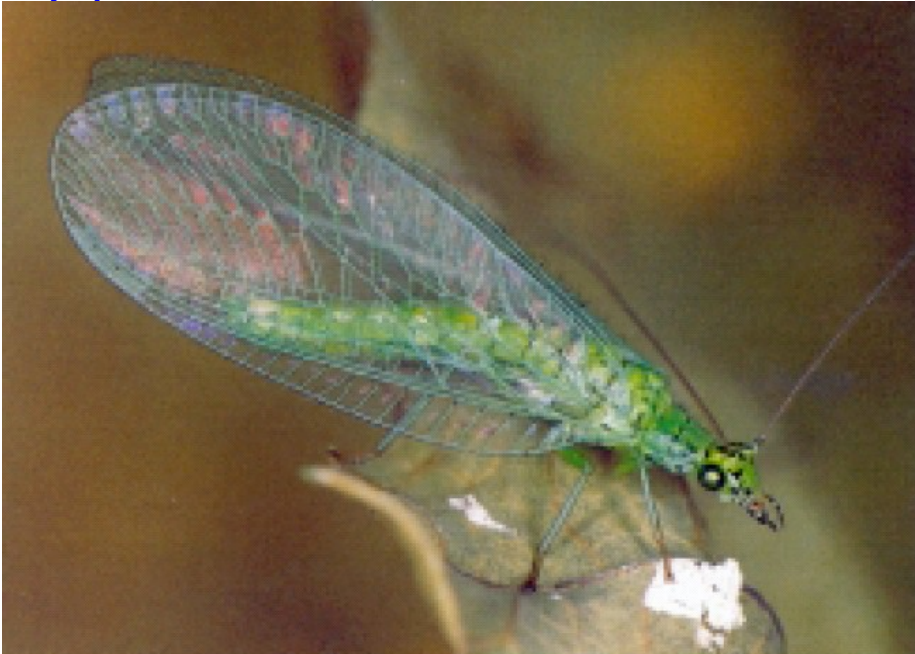
Adulto da Wachmann e Saure., 1997