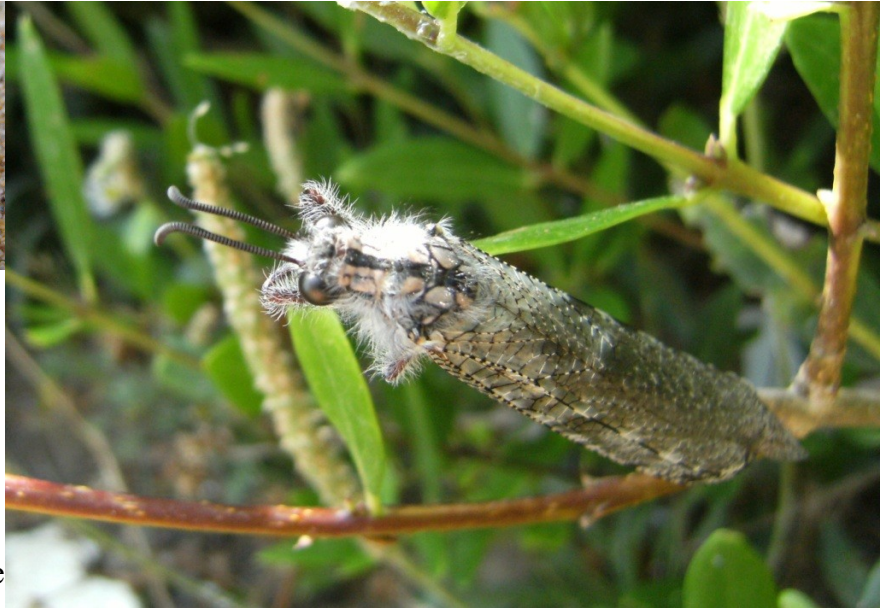
Adulto da Lenzini, 2008

Le larve di questa specie piuttosto rara colonizzano le sabbie arricchite di humus ed altre sostanze organiche delle depressioni dunali, retrodunali, dei boschi litoranei o comunque vegetanti su terreni sabbiosi (Steffan, 1975) dal livello del mare ai 1000 m (in Europa), sino i 2000 m (Nordafrica) (Aspöck et al., 1980); in Italia dovrebbe colonizzare il Tortulo-Scabiosetum .